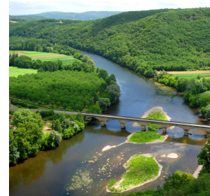
Tal der Dordogne