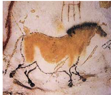
Höhle von Lascaux