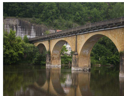
Dordognebrücke bei Luison